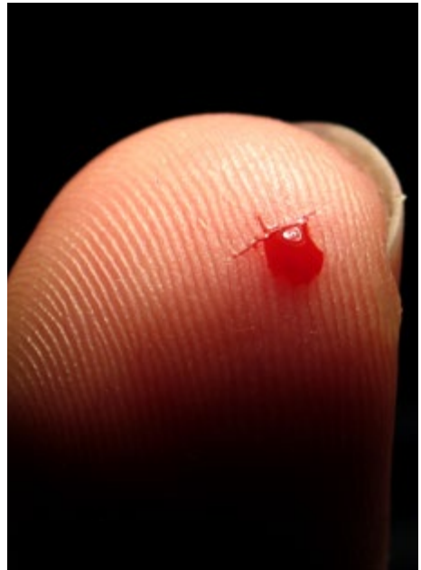
Abb. 6 Nadelstichverletzungen