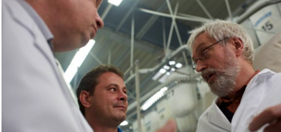
Abb. 2 Die Gefährdungsbeurteilung ist Basis zur Ableitung der Schutzmaßnahmen

Die Gefährdungsbeurteilung muss fachkundig durchgeführt werden. Verfügt die Arbeitgeberin bzw. der Arbeitgeber nicht selbst über die erforderlichen Kenntnisse, hat er sich fachkundig beraten zu lassen. Anforderungen an die Fachkunde werden in der TRBA 200 „Anforderungen an die Fachkunde nach Biostoffverordnung“ präzisiert [6].